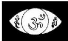
Igreja de Filadélfia

Quando o Kundalini chega à altura do entrecenho, abre–se a Igreja de Filadélfia. Este é o Olho da Sabedoria. Neste centro magnético mora o Pai que está em segredo. O chakra do entrecenho tem duas pétalas fundamentais e muitíssimas radiações esplendorosas. Este centro é o trono da mente. Nenhum verdadeiro clarividente diz que o é. Nenhum verdadeiro clarividente diz: "eu vi". O clarividente iniciado diz: "nós conceituamos".