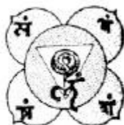
Igreja de Éfeso

A Igreja de Éfeso é um Loto com quatro pétalas esplendorosas, possuindo o brilho de dez milhões de sóis. A terra elemental dos sábios é conquistada com o poder desta Igreja.